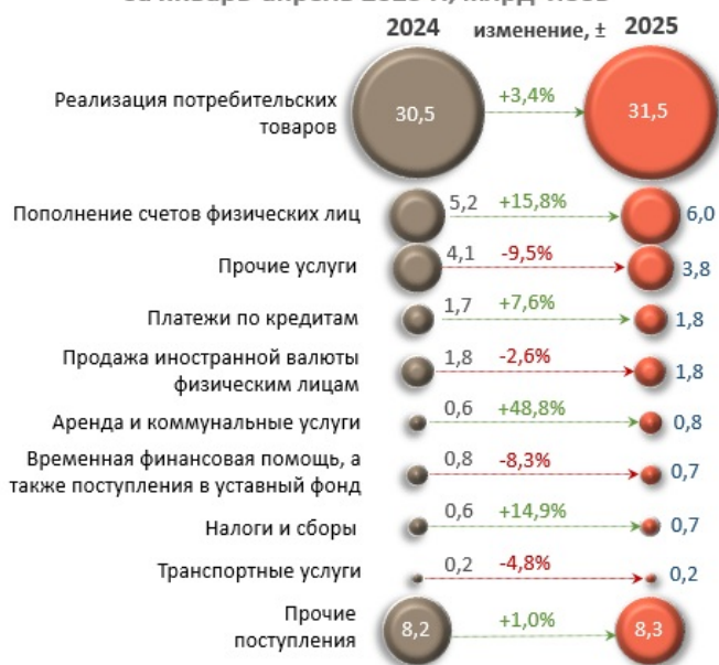
Основные источники денежных поступлений, совокупно за январь-апрель 2025 г., млрд леев