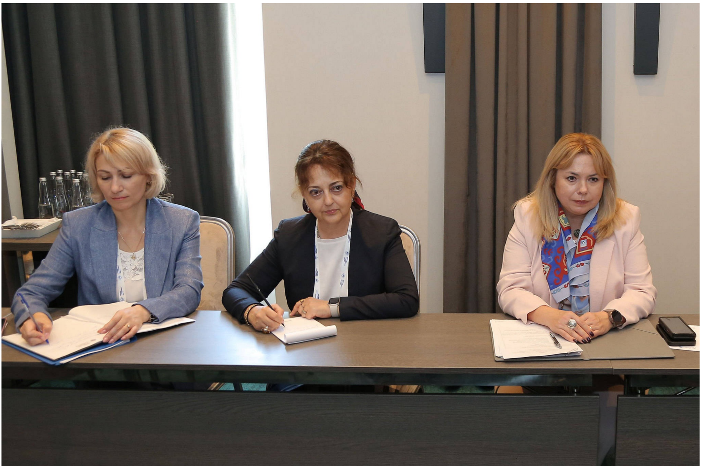
Встреча учредителей Международного валютного фонда и Всемирного банка в Кишиневе: