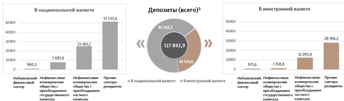
Диаграмма 3. Объём депозитов в апреле 2025 7 г., миллионы леев

Сальдо депозитов в национальной валюте увеличилось на 1 423,9 миллиона леев по сравнению с предыдущим месяцем, составив 85 361,3 миллиона леев, или 66,7% от общего сальдо депозитов. В то же время сальдо депозитов в иностранной валюте (пересчитанное в леех) уменьшилось на 145,3 миллиона леев по сравнению с предыдущим месяцем, до уровня 42 531,6 миллиона леев, с долей 33,3% (диаграмма 3).