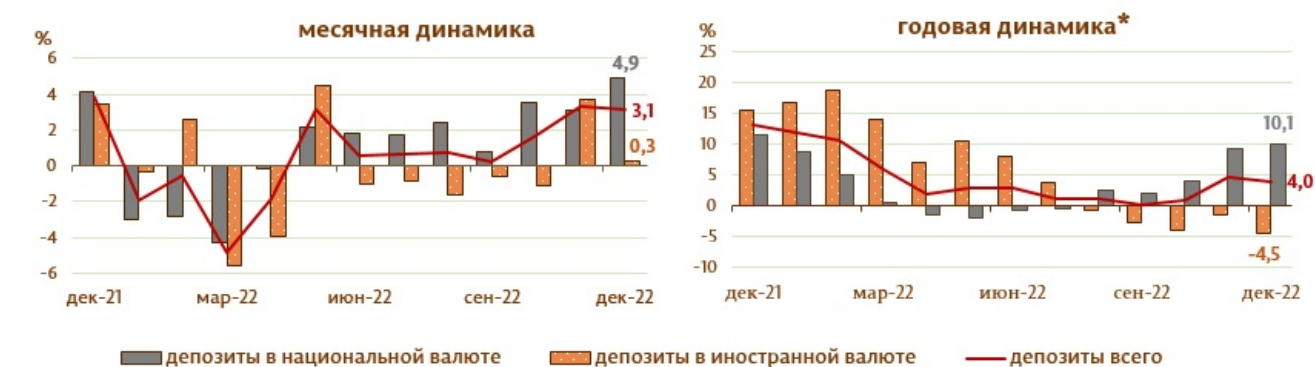
Диаграмма 2. Динамика депозитов 7 , %