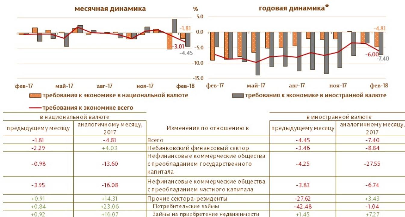
Диаграмма 3. Динамика требований к экономике

Следует отметить, что требования к экономике в иностранной валюте, выраженные в долларах США, в течении отчетного периода снизились на 44.3 млн. долларов США (4.3%).