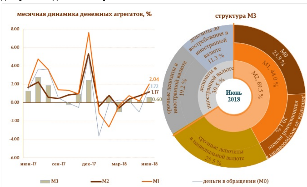
Диаграмма 1. Денежный агрегат M3

Сальдо депозитов в национальной валюте увеличилось на 310.6 млн. леев и составило 35538.0 млн. леев, составив долю 59.9% от общего сальдо депозитов, а сальдо депозитов в иностранной валюте (пересчитанное в