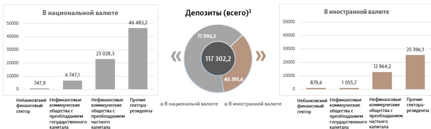
Диаграмма 3. Объем депозитов в июне 2024 г. 7 , миллионы леев

Сальдо депозитов в национальной валюте увеличилось на 180,1 миллиона леев по сравнению с предыдущим месяцем до уровня в 77 006,5 миллиона леев, составив 65,6% от общего сальдо депозитов. В то же время сальдо депозитов в иностранной валюте (пересчитанное в леях) уменьшилось на 168,7 миллиона леев по сравнению с предыдущим месяцем, до уровня 40 295,6 миллиона леев, с долей 34,4% (диаграмма 3).