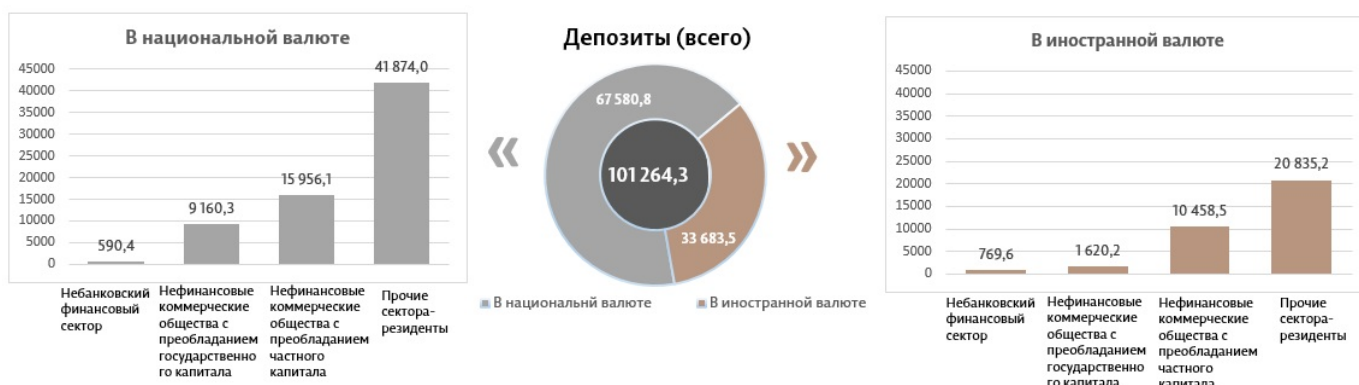
Диаграмма 3. Объем депозитов в мае 2023 7 , миллионы леев

Сальдо депозитов в национальной валюте увеличилось на 2 281,3 миллиона леев по сравнению с предыдущим месяцем и составило 67 580,8 миллиона леев, составив долю 66,7% от общего сальдо депозитов. В то же время сальдо депозитов в иностранной валюте (пересчитанное в леях) увеличилось на 220,4 миллиона леев по сравнению с предыдущим месяцем, до уровня 33 683,5 миллиона леев, с долей 33,3% (диаграмма 3).