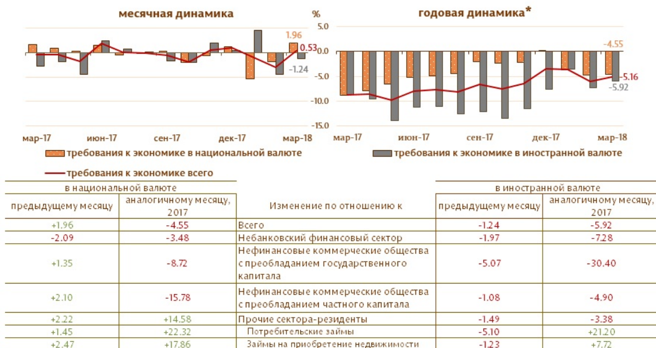
Диаграмма 3. Динамика требований к экономике

Следует отметить, что требования к экономике в валюте, выраженные в долларах США, в течении отчетного периода увеличились на 1.2 млн. долларов США (0.1%).