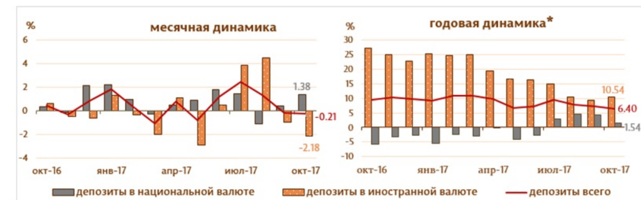
Диаграмма 2. Динамика депозитов Структура депозитов группируется по институциональным секторам в соответствии с Инструкцией о порядке составления и предоставления банками отчета по денежной статистике (Monitorul Oficial al Republicii Moldova nr. 206-215 din 2 decembrie 2011) [1]

Сальдо депозитов в национальной валюте увеличилось на 429.1 млн. леев и составило 31614.3 млн. леев, составив долю 56.1% от общего сальдо депозитов, а сальдо депозитов в иностранной валюте (пересчитанное в леях) снизилось на 549.8 млн. леев, до уровня 24716.7 млн. леев, с долей 43.9% (диаграмма № 2).