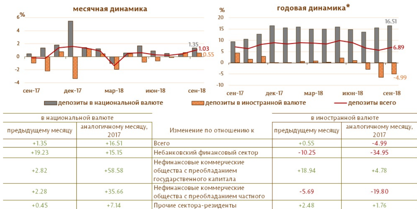
Диаграмма 2. Динамика депозитов 6 Структура депозитов группируется по институциональным секторам в соответствии с Инструкцией о порядке составления и предоставления банками отчета по денежной статистике (Monitorul Oficial al Republicii Moldova nr. 206-215 din 2 decembrie 2011) [1]

Увеличение денежной массы М3 в отчетном периоде исходя из перспективы ее балансирующих статей было определено ростом чистых внешних активов 7 банковской системы на 1873.1 млн. леев (2.7%), в то время как чистых внутренних активов 8 снизились на 865.1 млн. леев (9.4%).