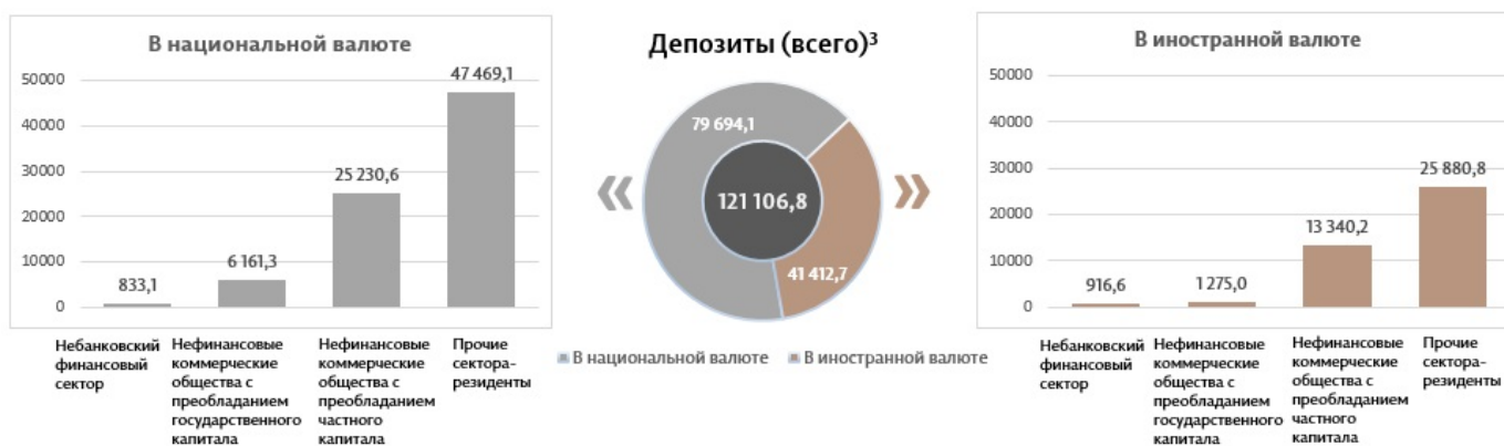
Диаграмма 3. Объём депозитов в сентябре 2024 г. 7 , миллионы леев

Сальдо депозитов в национальной валюте увеличилось на 844,8 миллиона леев по сравнению с предыдущим месяцем, составив 79 694,1 миллиона леев, или 65,8% от общего сальдо депозитов. В то же время сальдо депозитов в иностранной валюте (пересчитанное в леях) уменьшилось на 636,4 миллиона леев по сравнению с предыдущим месяцем, до уровня 41 412,7 миллиона леев, с долей 34,2% (диаграмма 3).