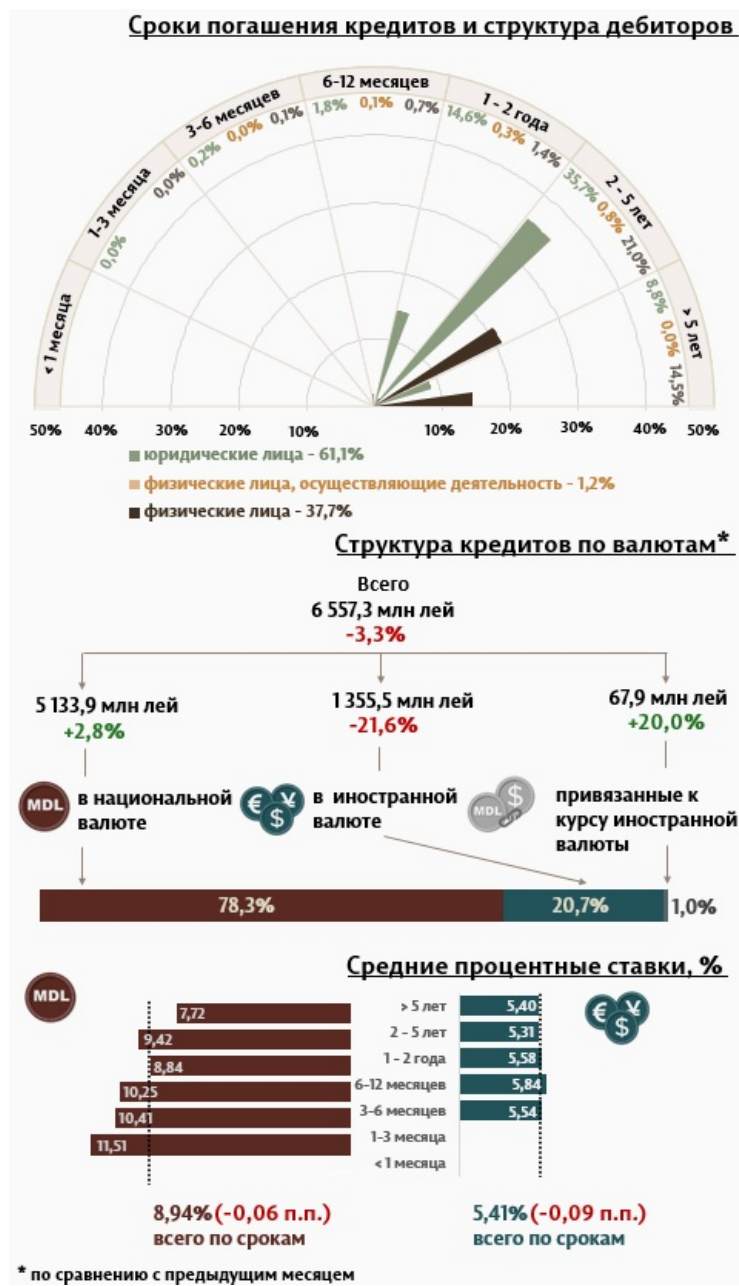
Инфографика 1. Динамика вновь выданных кредитов

В разрезе сроков выданных кредитов, наибольшим спросом пользовались кредиты со сроком от 2 до 5 лет, доля которых составила 57,5% от общего объема выданных кредитов. Объем данных кредитов, выданных юридическим лицам, составил 35,7% от общего объема кредитов.