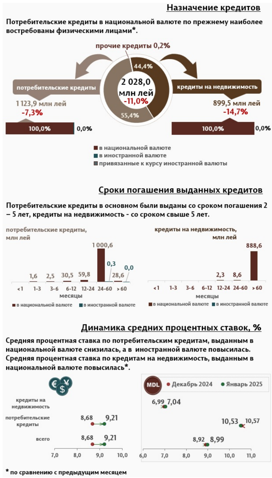
Инфографика 2. Вновь выданные кредиты физическим лицам

Кредиты на недвижимость были предоставлены только в национальной валюте и составляют 44,4% от общего объёма кредитов, выданных физическим лицам.