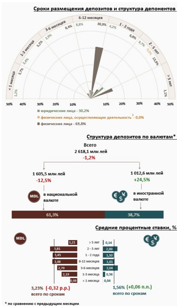
Инфографика 1. Динамика вновь привлеченных депозитов 2

Средняя номинальная ставка по новым депозитам, привлеченным в национальной валюте, снизилась на 0,32