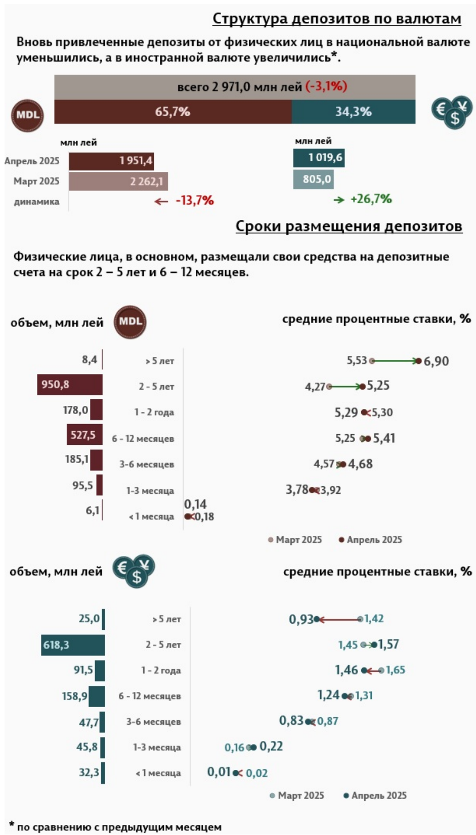
Инфографика 2. Вновь привлечённые срочные депозиты от физических лиц

2 до 5 лет с долей 52,8% и депозиты со сроком от 6 до 12 месяцев с долей 23,1% от общего объёма депозитов физических лиц. По сравнению с апрелем 2024 г., объём вновь привлечённых депозитов от физических лиц в национальной валюте, увеличился на 80,6%, а в иностранной валюте на 36,6%.