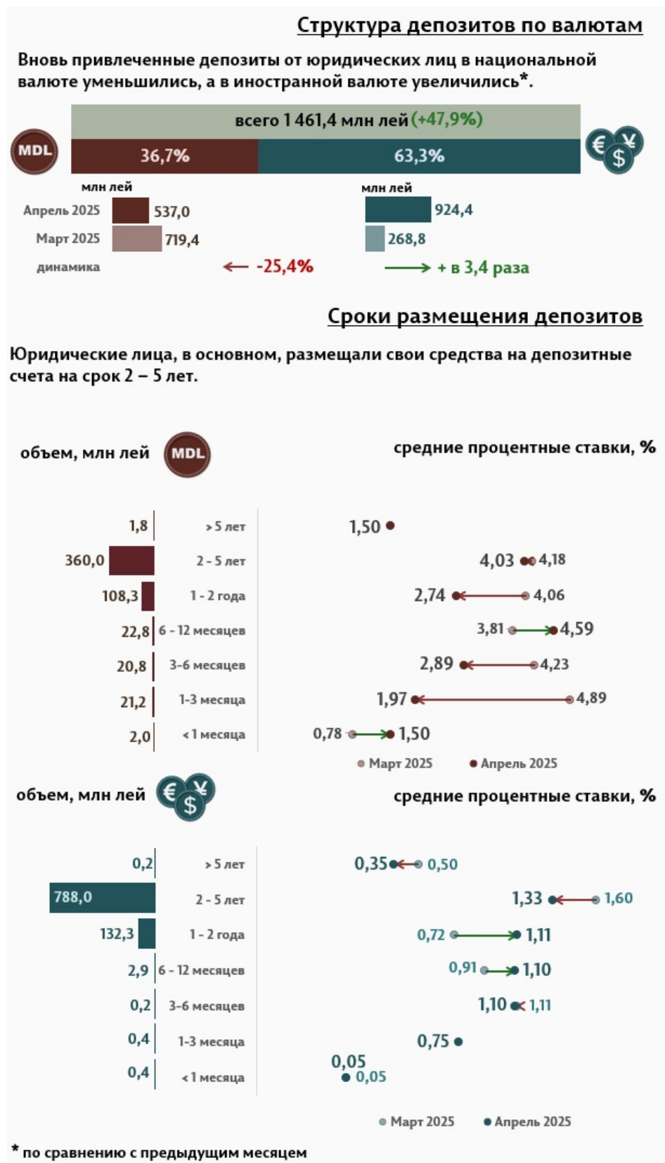
Инфографика 3. Вновь привлечённые срочные депозиты от юридических лиц

Средняя ставка по депозитам, привлечённым в национальной валюте от юридических лиц, по сравнению с предыдущим месяцем снизилась на 0,50 п.п., до уровня 3,65%, а средняя ставка по депозитам, привлечённым в