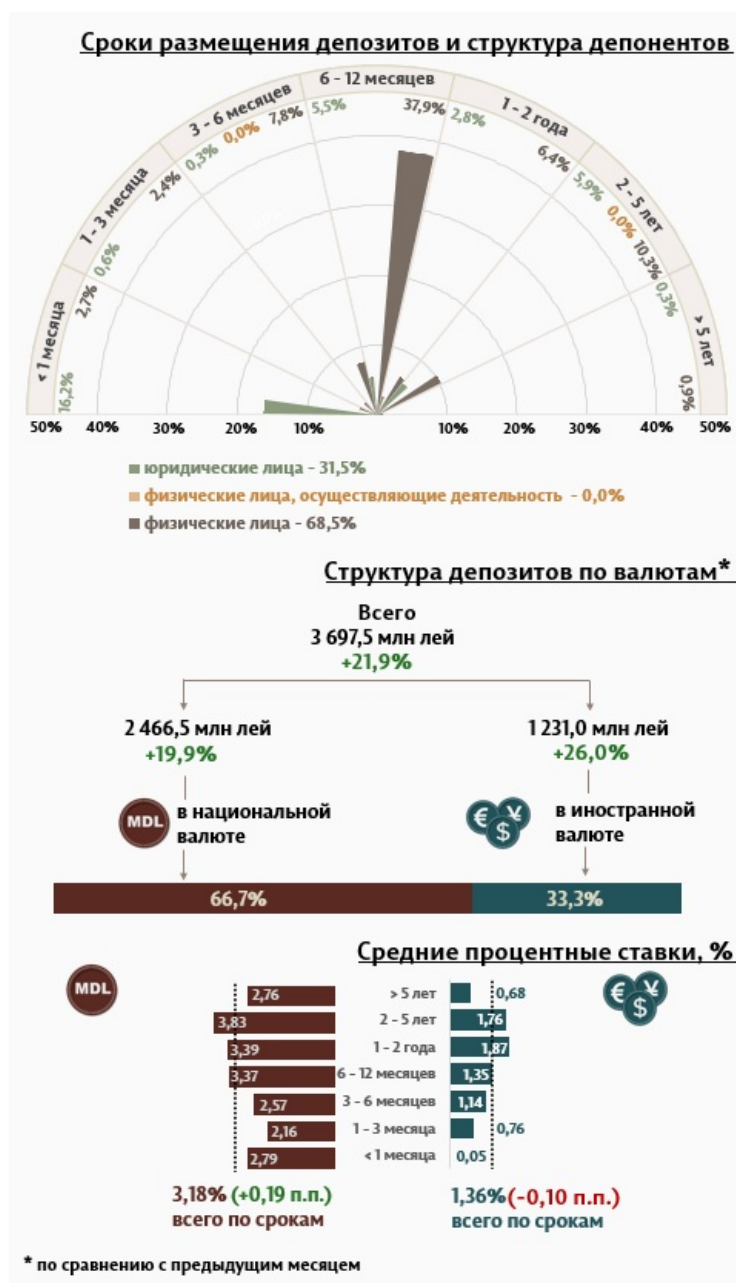
Инфографика 1. Динамика вновь привлечённых депозитов

В августе 2024 г. вновь привлечённые срочные депозиты 1 (Инфографика 1) составили 3 697,5 миллиона леев, увеличившись на 21,9% по сравнению с июлем 2024 года. Привлечённые депозиты в национальной валюте составили наибольшую долю в 66,7% или 2 466,5 миллиона леев, что на 19,9% больше по сравнению с предыдущим месяцем. Депозиты, привлечённые в иностранной валюте, составили 1 231,0 миллиона леев, увеличившись на 26,0% по сравнению с предыдущим месяцем.