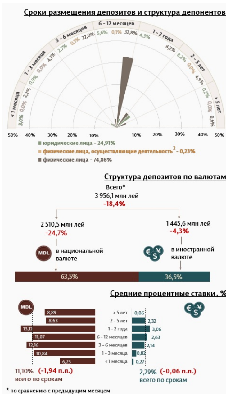
Инфографика 1. Динамика вновь привлеченных депозитов

Средняя номинальная ставка по новым депозитам, привлеченным в национальной валюте, снизилась на 1,94 процентных пункта по сравнению с предыдущим месяцем и составила 11,10%. Средняя номинальная ставка по депозитам в иностранной валюте снизилась на 0,06 процентных пункта, составив 2,29%.