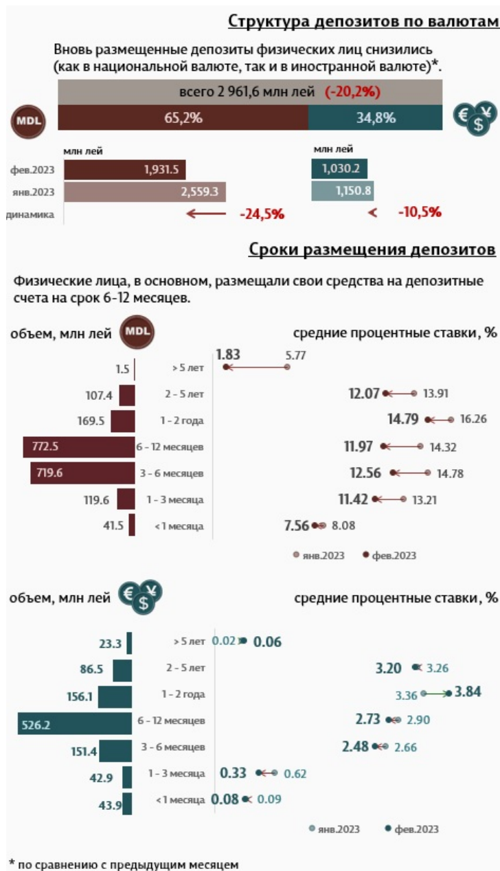
Инфографика 2. Вновь привлеченные срочные депозиты от физических лиц

Депозиты физических лиц в феврале 2023 года составили 2 961,6 миллиона леев, уменьшившись на 20,2% по сравнению с предыдущим месяцем.