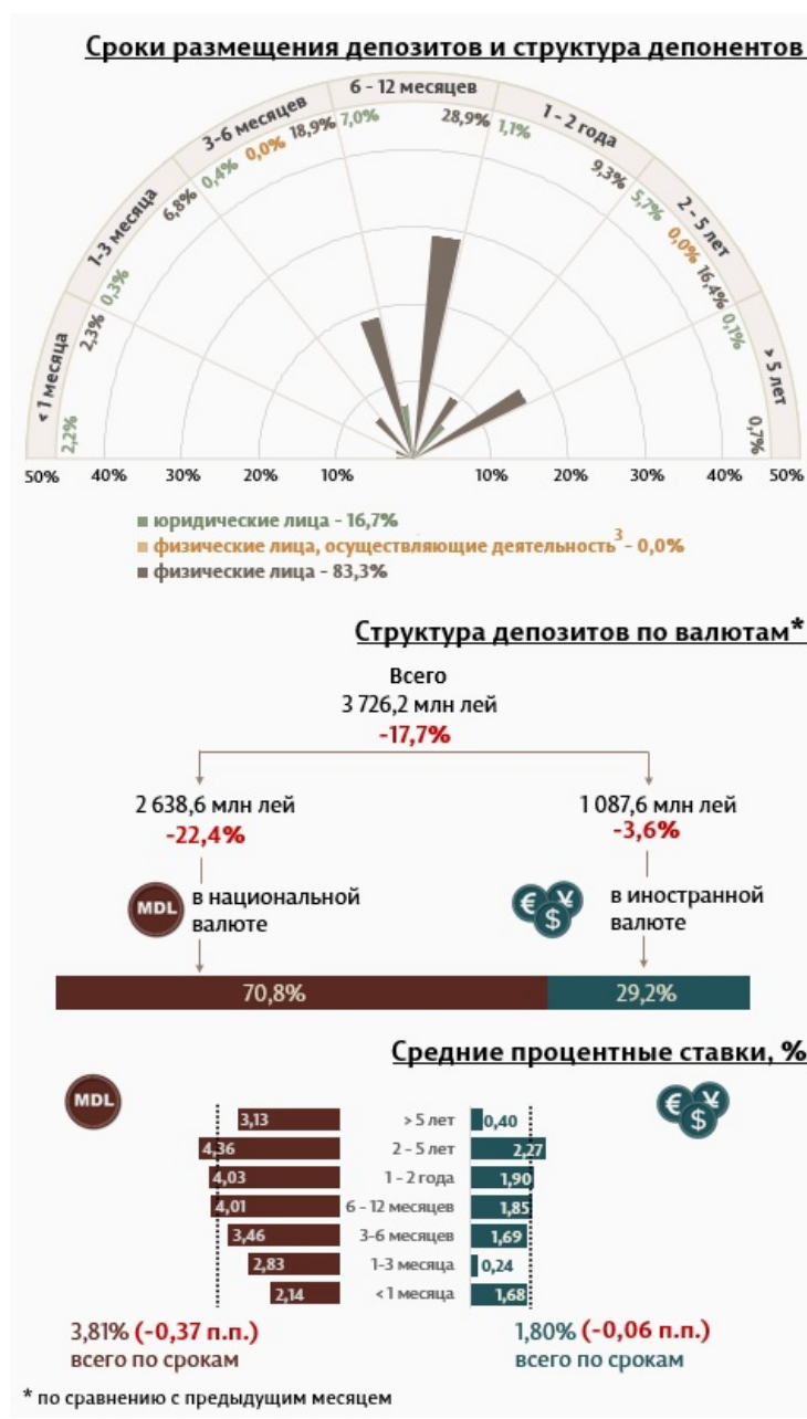
Инфографика 1. Динамика вновь привлеченных депозитов 2

В феврале 2024 г. вновь привлеченные срочные депозиты 1 (Инфографика 1) составили 3 726,2 миллиона леев, на 17,7% ниже января 2024 года. Привлеченные депозиты в национальной валюте составили наибольшую долю в 70,8% или 2 638,6 миллиона леев, что на 22,4% ниже по сравнению с предыдущим месяцем. Депозиты, привлеченные в иностранной валюте, составили 1 087,6 млн леев, снизившись на 3,6% по сравнению с предыдущим месяцем.