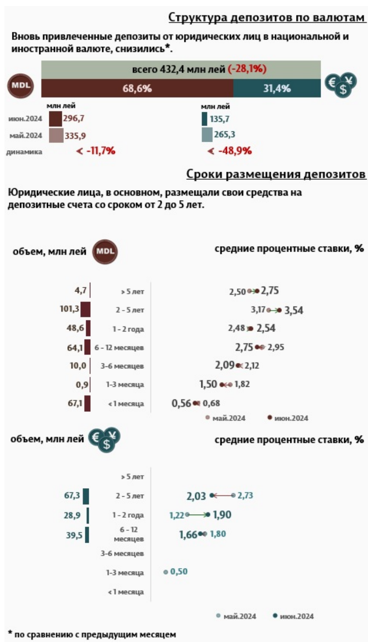
Инфографика 3. Вновь привлеченные срочные депозиты от юридических лиц

Средняя ставка по депозитам, привлеченным от юридических лиц в национальной валюте, снизилась на 0,23 п. п., до уровня 2,46%. В то же время средняя ставка по депозитам, привлеченным в иностранной валюте, увеличилась на 0,21 п. п. и составила 1,89%.