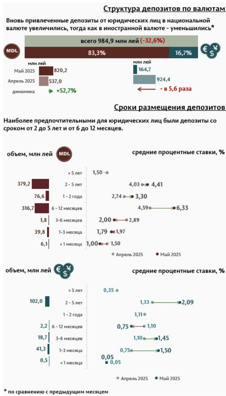
Инфографика 3. Вновь привлечённые срочные депозиты от юридических лиц

Средняя ставка по депозитам, привлечённым в национальной валюте от юридических лиц повысилась по сравнению с предыдущим месяцем на 1,24 п. п. до уровня 4,89%, в то время как средняя ставка по депозитам, привлечённым в иностранной валюте, повысилась на 0,55 п. п. и составила 1,85%.