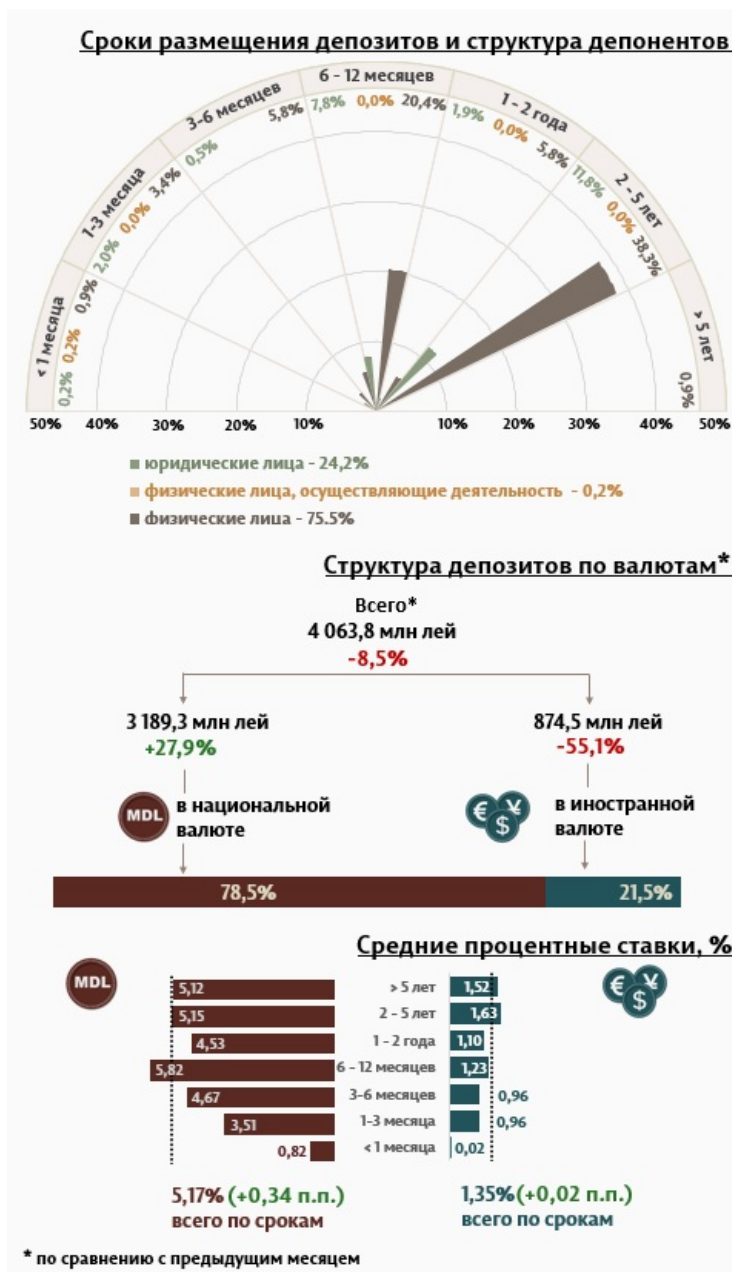
Инфографика 1. Динамика вновь привлечённых депозитов

В мае 2025 г. вновь привлечённые срочные депозиты 1 (Инфографика 1) составили 4 063,8 миллиона леев, уменьшившись на 8,5% по сравнению с апрелем 2025 года. Привлечённые депозиты в национальной валюте составили наибольшую долю в 78,5% или 3 189,3 миллиона леев, что на 27,9% больше по сравнению с предыдущим месяцем. Депозиты, привлечённые в иностранной валюте, составили 874,5 миллиона леев, уменьшившись на 55,1% по сравнению с предыдущим месяцем.