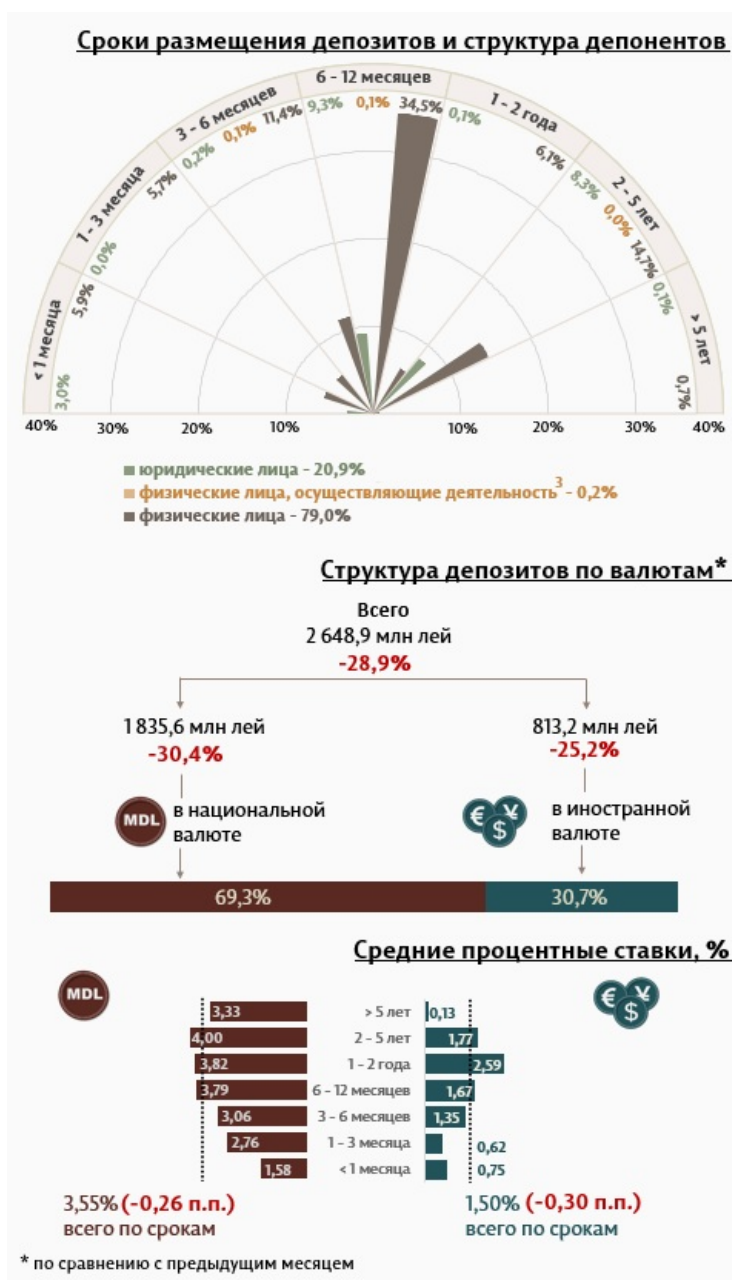
Инфографика 1. Динамика вновь привлеченных депозитов 2

Средняя номинальная ставка по новым депозитам, привлеченным в национальной валюте, уменьшилась на