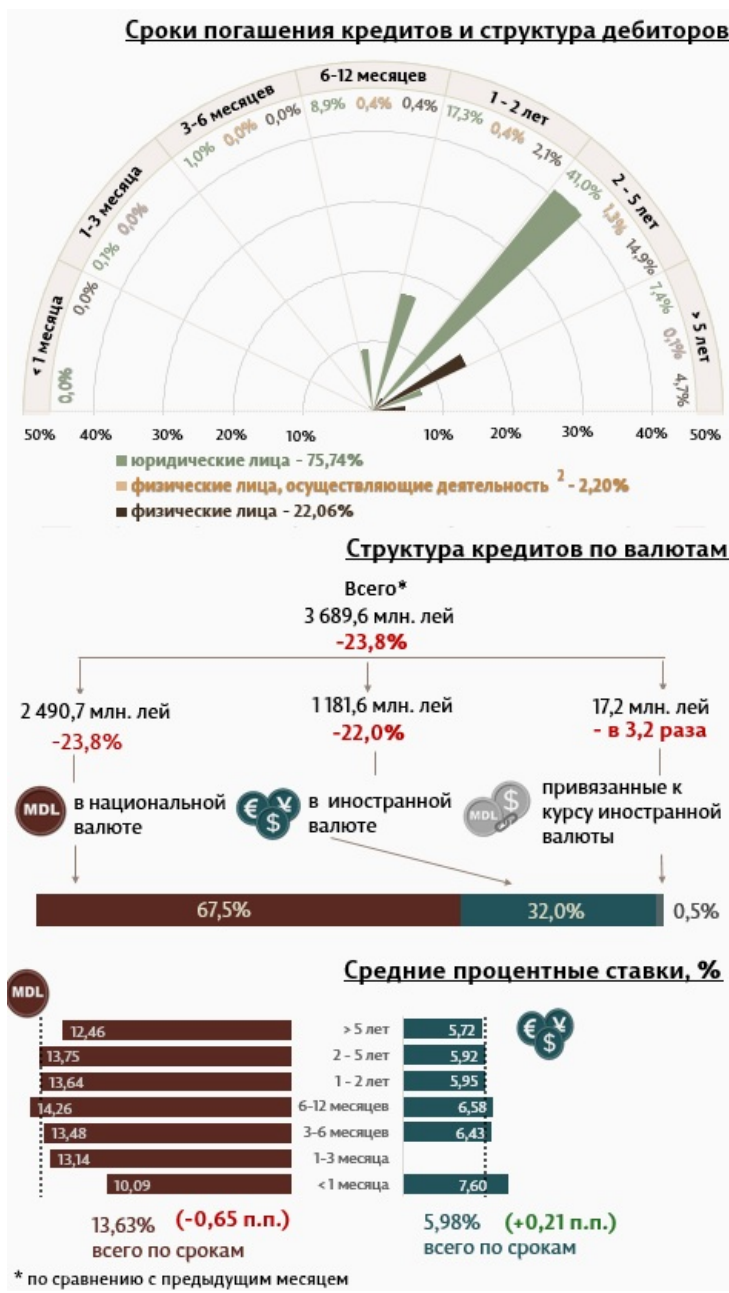
Инфографика 1. Динамика вновь выданных кредитов

В апреле 2023 вновь выданные кредиты 1 (Инфографика 1) составили 3 689,6 миллиона леев, на 23,8% ниже марта 2022 г. Основную часть (67,5%) составляют кредиты в национальной валюте, которые составили 2 490,7 миллиона леев, на 23,8% ниже по сравнению с предыдущим месяцем.