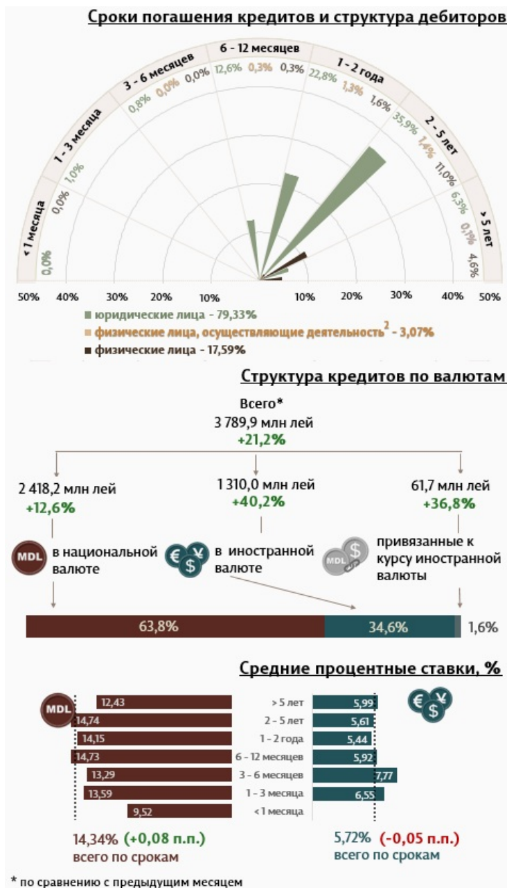
Инфографика 1. Динамика вновь выданных кредитов

Из перспективы сроков выданных кредитов, самыми привлекательными были кредиты, выданные сроком от 2 до 5 лет с долей 48,3% от общего объема выданных кредитов. Объем данных кредитов, выданных юридическим лицам, составил 35,9% от общего объема кредитов.