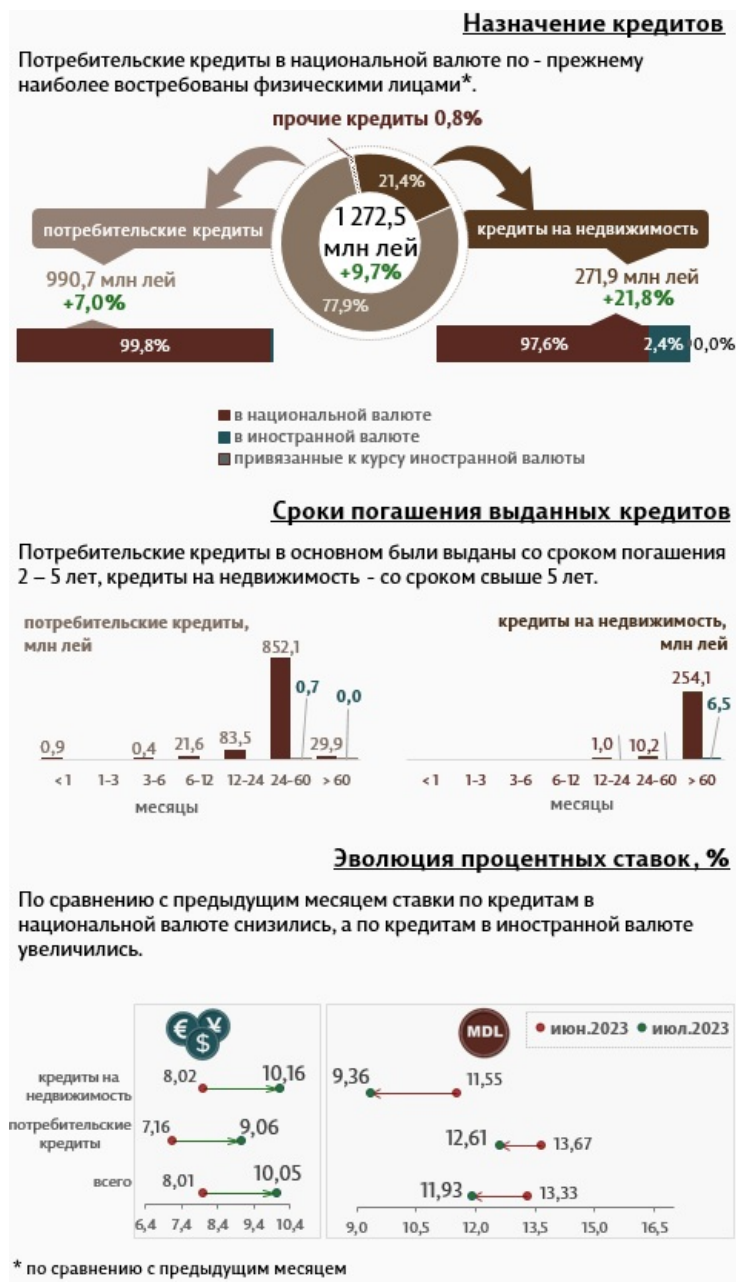
Инфографика 2. Вновь выданные кредиты физическим лицам 3

Кредиты на недвижимость составляют 21,4% от всех кредитов, выданных физическим лицам, и были предоставлены в основном в национальной валюте (97,6% от общего объема кредитов на недвижимость).