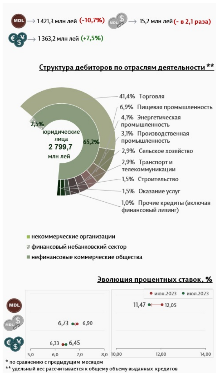
Инфографика 3. Вновь выданные кредиты юридическим лицам

Средняя ставка по кредитам, выданным юридическим лицам (инфографика 3) в национальной валюте, снизилась на 0,58 процентных пункта, до уровня 11,47%. В то же время средняя ставка по кредитам, выданным в иностранной валюте, увеличилась на 0,12 процентных пункта и составила 6,45%.