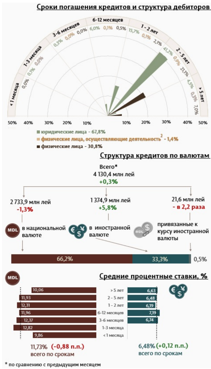
Инфографика 1. Динамика вновь выданных кредитов

С точки зрения сроков выдачи кредитов, самыми привлекательными были кредиты, выданные на срок от 2 до 5 лет с долей 63,2% от общего объема выданных кредитов. Объем данных кредитов, выданных юридическим лицам, составил 41,2% от общего объема кредитов.