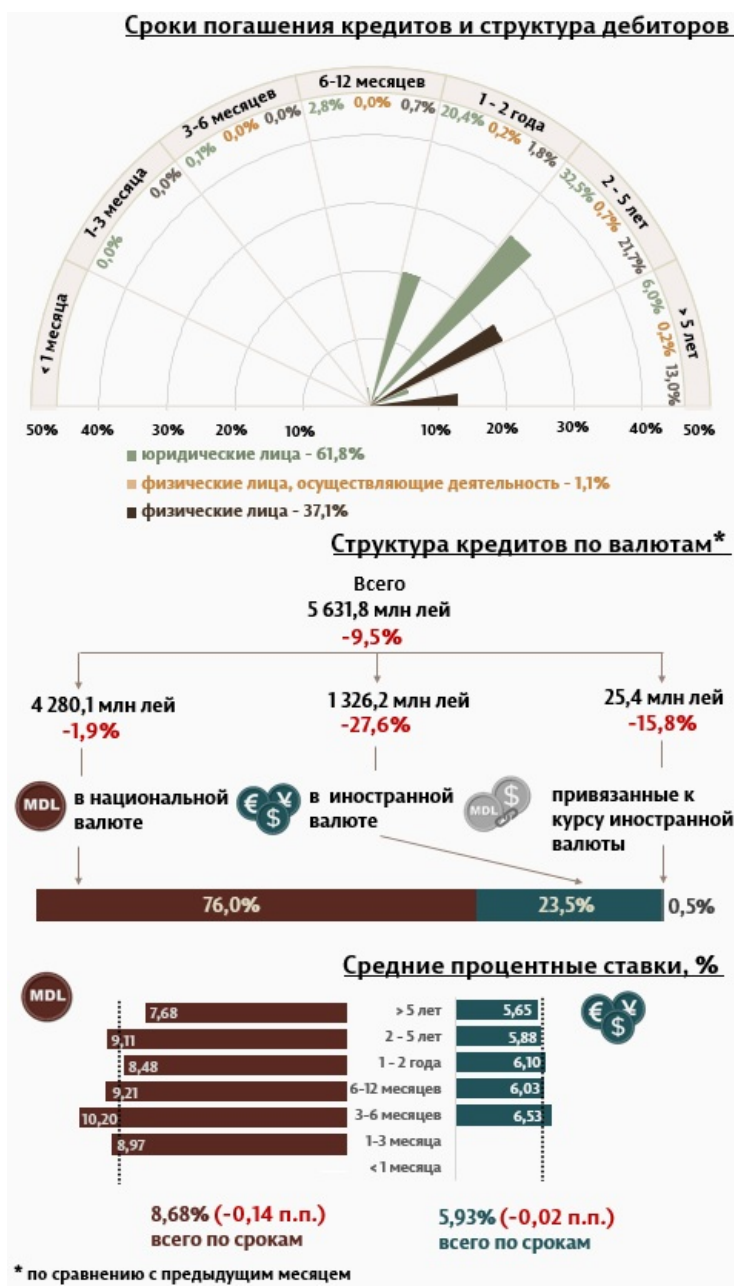
Инфографика 1. Динамика вновь выданных кредитов

С точки зрения сроков выданных кредитов, наибольшим спросом пользовались кредиты на срок от 2 до 5 лет, доля которых составила 54,9% от общего объема выданных кредитов. Объем данных кредитов, выданных юридическим лицам, составил 32,5% от общего объема кредитов.