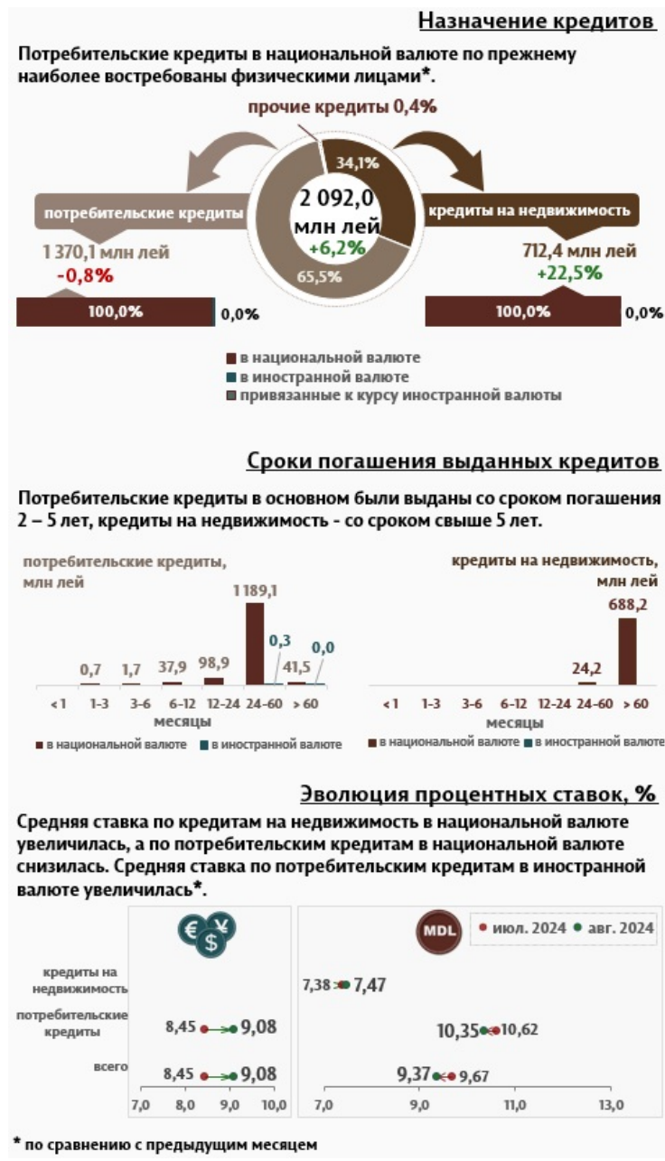
Инфографика 2. Вновь выданные кредиты физическим лицам

Кредиты на недвижимость были представлены только в национальной валюте и составляют 34,1% от общего объема кредитов выданных физическим лицам.