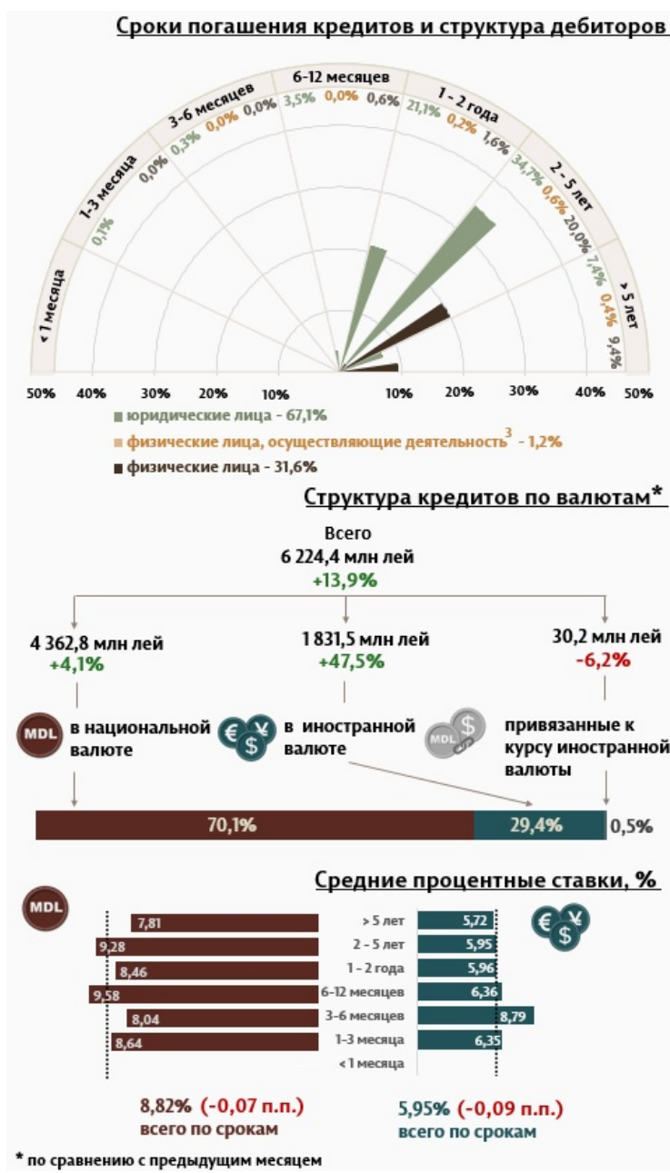
Инфографика 1. Динамика вновь выданных кредитов 2

С точки зрения сроков выданных кредитов, наибольшим спросом пользовались кредиты на срок от 2 до 5 лет, доля которых составила 55,3% от общего объема выданных кредитов. Объем данных кредитов, выданных юридическим лицам, составил 34,7% от общего объема кредитов.