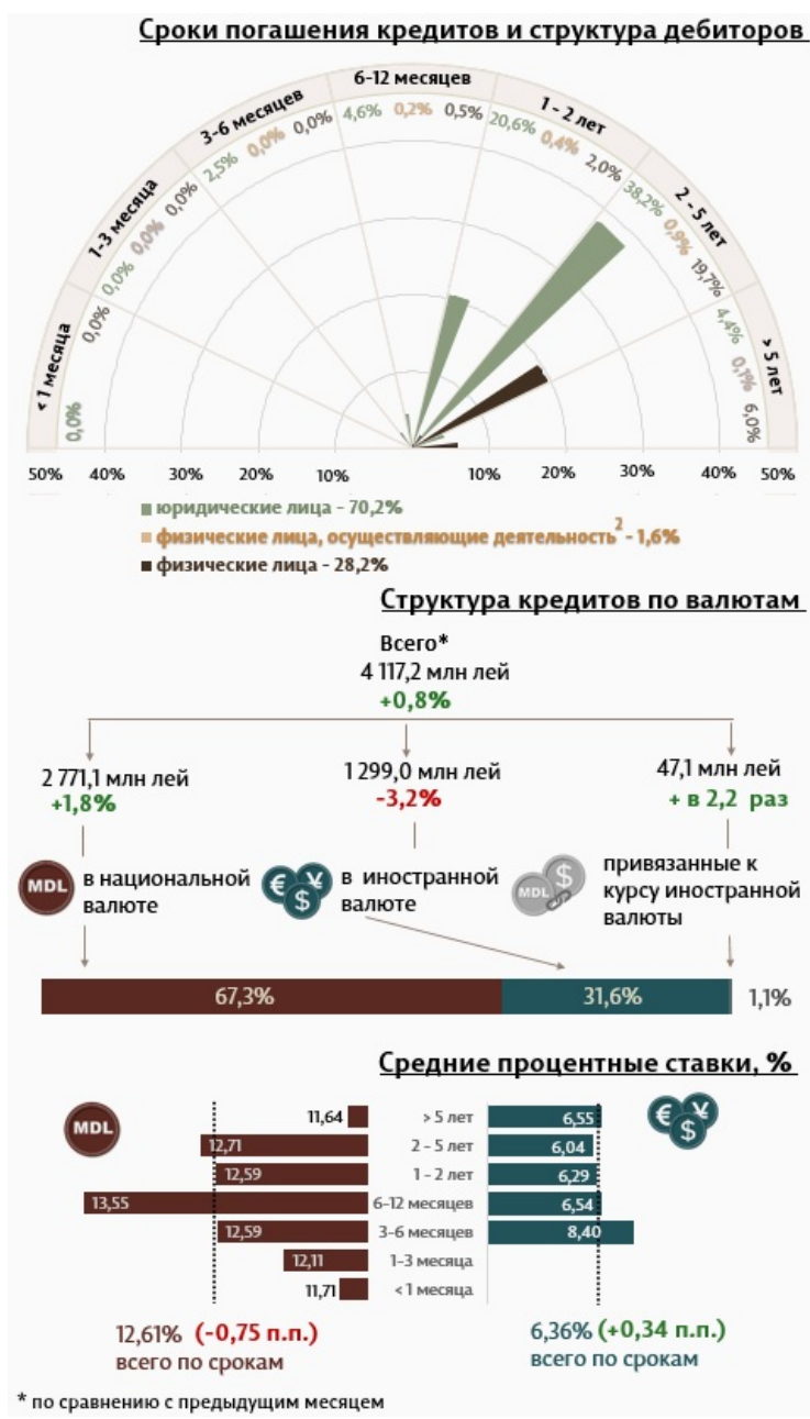
Инфографика 1. Динамика вновь выданных кредитов.

С точки зрения сроков выданных кредитов, самыми привлекательными были кредиты, выданные на срок от 2 до 5 лет, которые составили 58,7% от общего объема выданных кредитов. Объем данных кредитов, выданных юридическим лицам, составил 38,2% от общего объема кредитов.