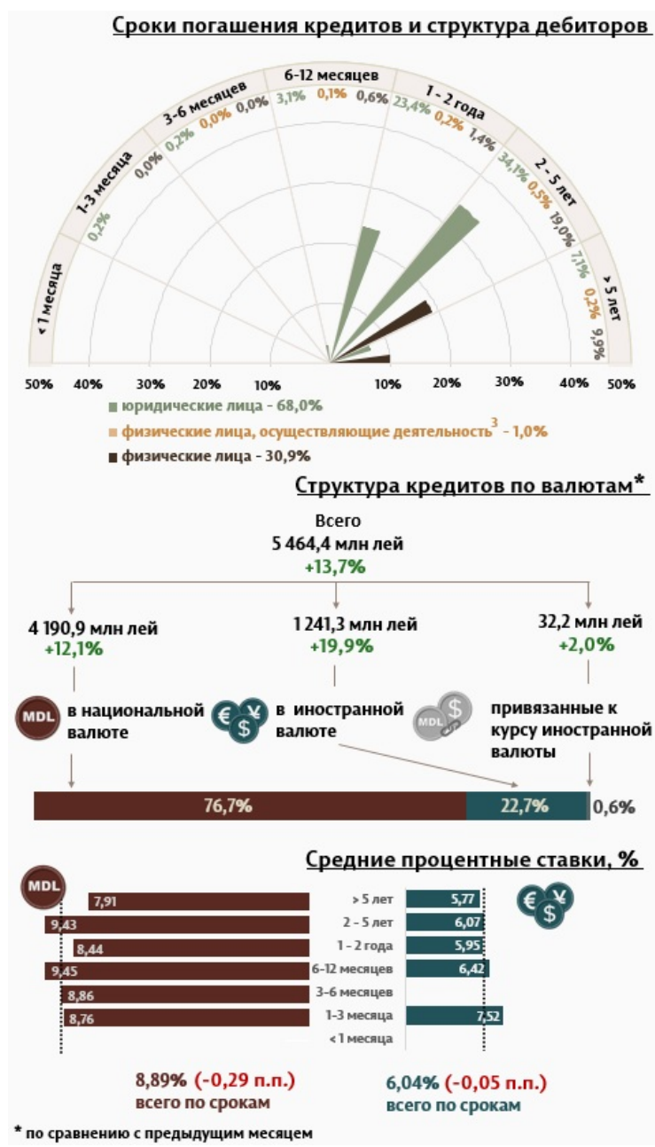
Инфографика 1. Динамика вновь выданных кредитов 2

С точки зрения сроков выданных кредитов, наибольшим спросом пользовались кредиты на срок от 2 до 5 лет, доля которых составила 53,5% от общего объема выданных кредитов. Объем данных кредитов, выданных юридическим лицам, составил 34,1% от общего объема кредитов.