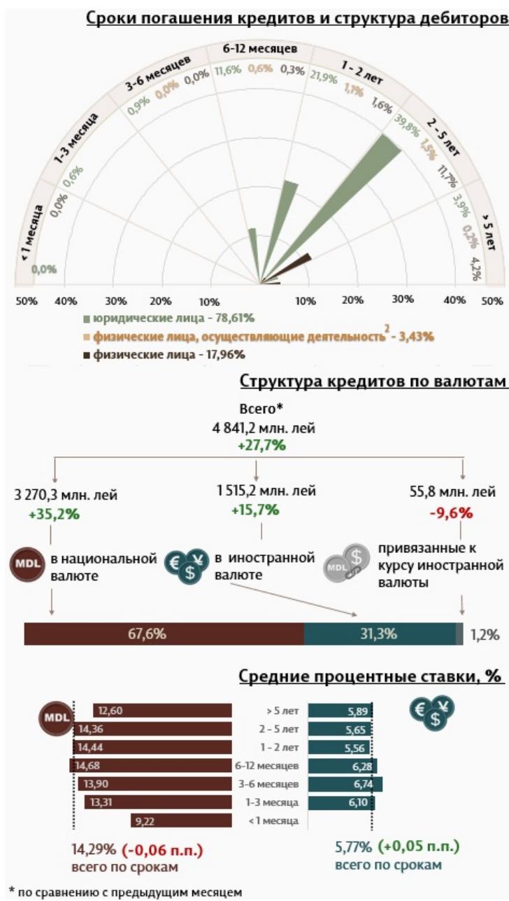
Инфографика 1. Динамика вновь выданных кредитов

Из перспективы сроков выданных кредитов, самыми привлекательными были кредиты, выданные сроком от 2 до 5 лет с долей 53,1% от общего объема выданных кредитов. Объем данных кредитов, выданных юридическим лицам, составил 39,8% от общего объема кредитов.