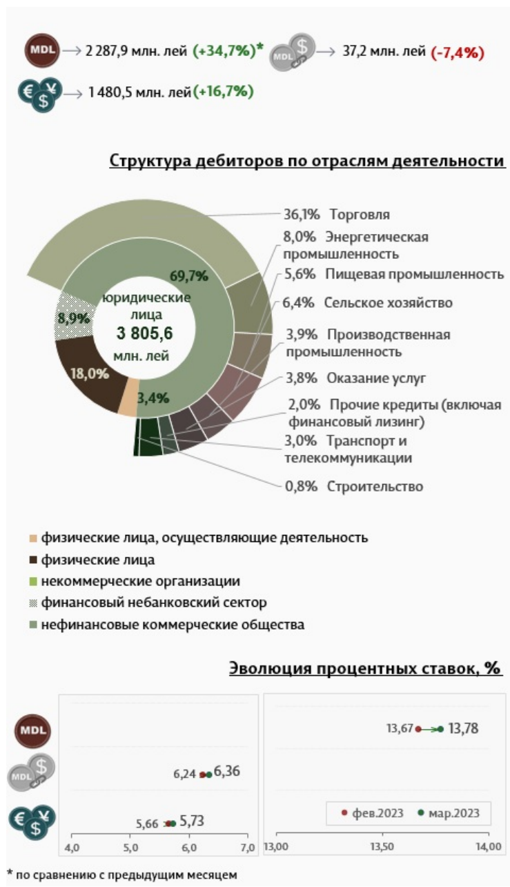
Инфографика 3. Вновь выданные кредиты юридическим лицам

Средняя ставка по кредитам, выданным юридическим лицам (Инфографика 3) в национальной валюте, увеличилась на 0,10 процентных пункта, до уровня 13,78%. В то же время средняя ставка по кредитам, выданным в иностранной валюте, увеличилась на 0,07 процентных пункта и составила 5,73%.