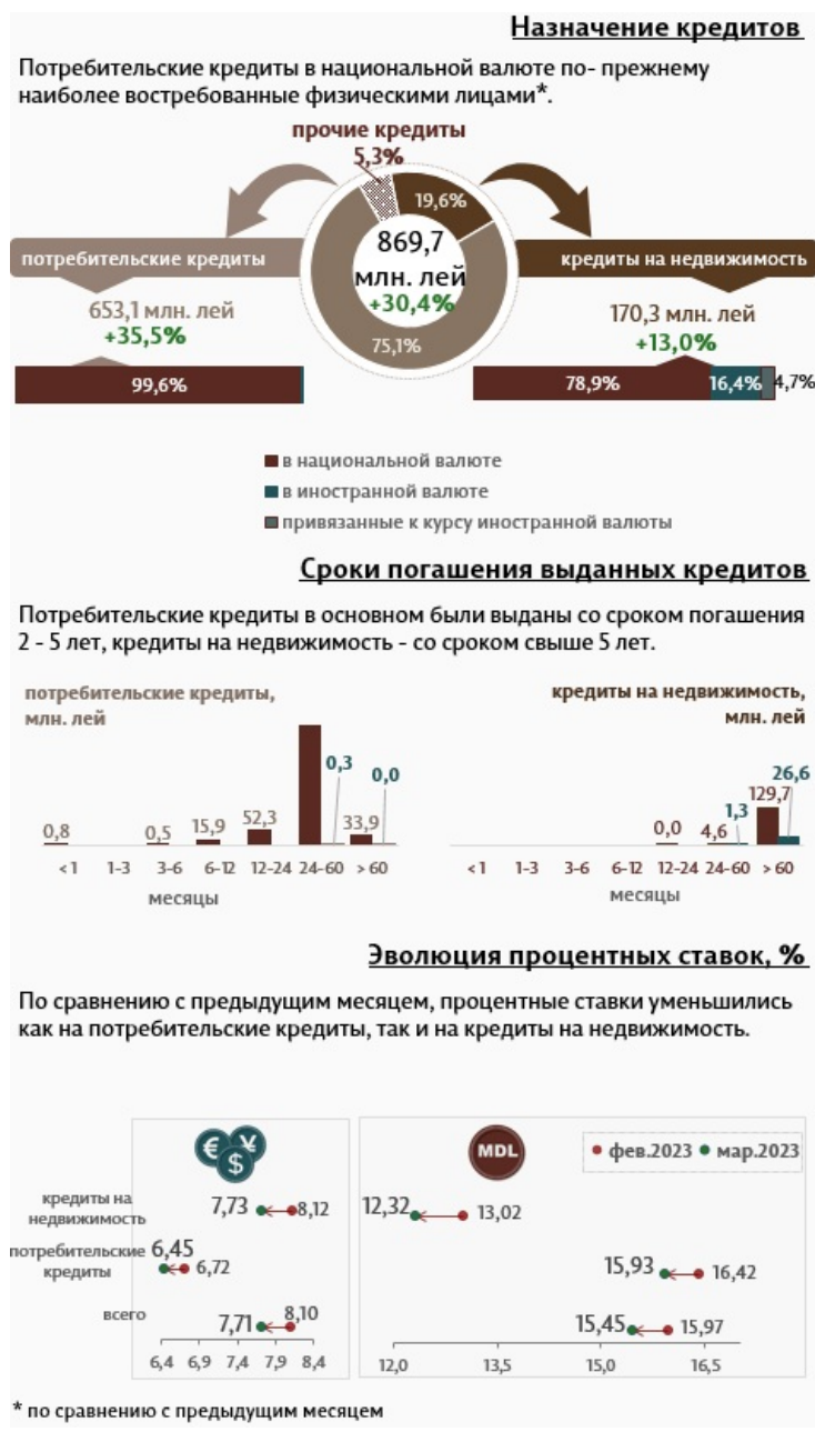
Инфографика 2. Вновь выданные кредиты физическим лицам

Физические лица в марте 2023 года получили кредиты (Инфографика 2) в объеме 869,7 миллиона леев, что на 30,4% выше по сравнению с предыдущим месяцем, большая часть (75,1%) была предоставлена потребительскими кредитами. Большая часть этих кредитов (547,3 миллиона леев) были выданы в национальной валюте сроком от 2 до 5 лет.