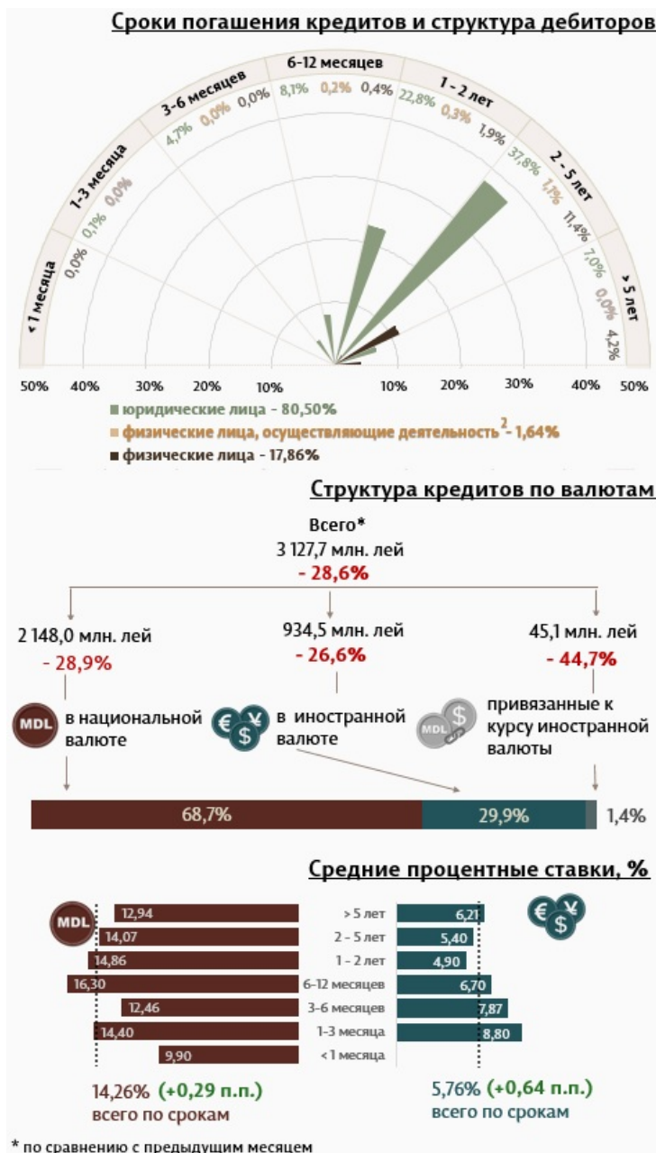
Инфографика 1. Динамика вновь выданных кредитов

Из перспективы сроков выданных кредитов, самыми привлекательными были кредиты, выданные сроком от 2 до 5 лет с долей 50,3% от общего объема выданных кредитов. Объем данных кредитов, выданных