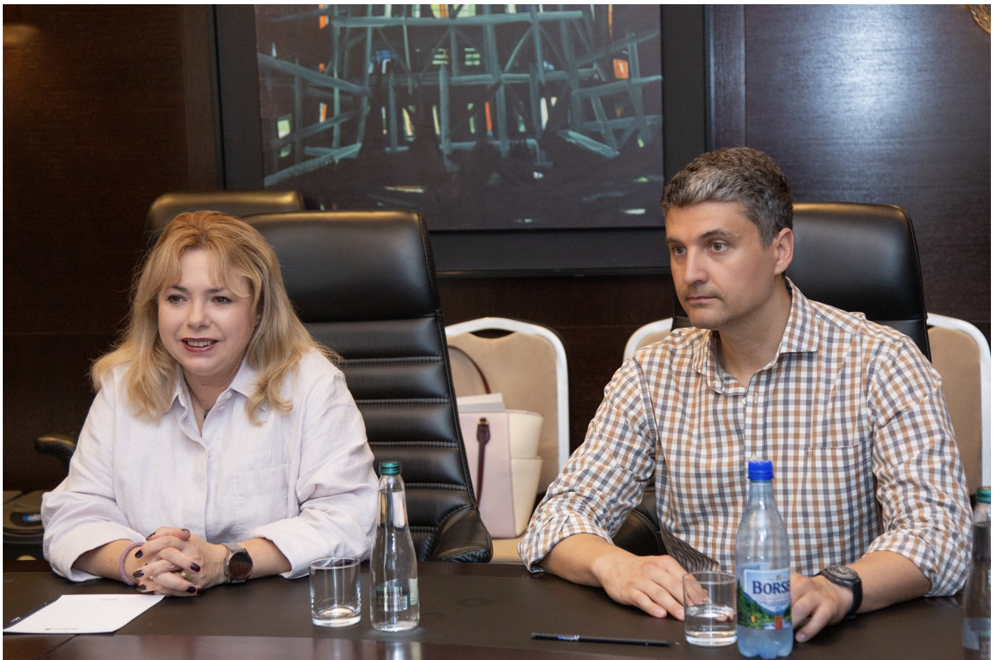
Встреча учредителей Международного валютного фонда и Всемирного банка в Кишиневе: