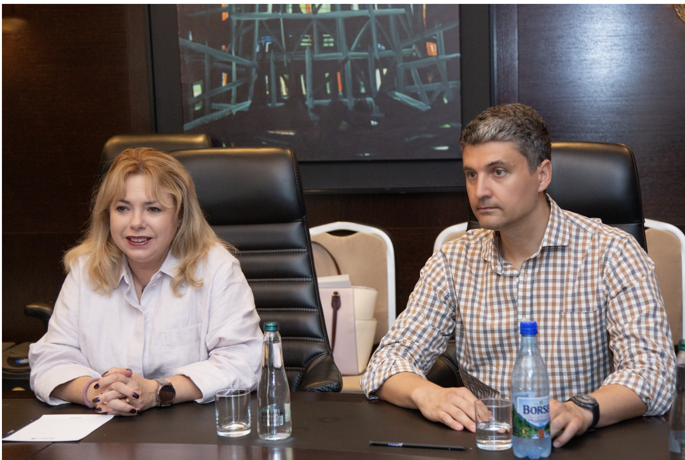
Встреча учредителей Международного валютного фонда и Всемирного банка в Кишиневе: