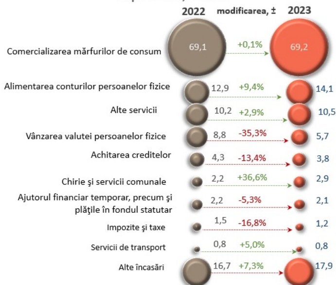
Principalele surse de încasări, cumulativ ianuarie – septembrie, mld. lei