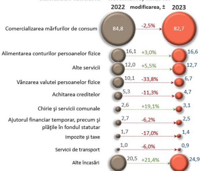
Principalele surse de încasări, cumulativ ianuarie – noiembrie, mld. lei