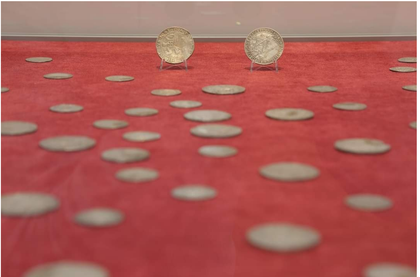
Метки Monede vechi - monede noi [1]