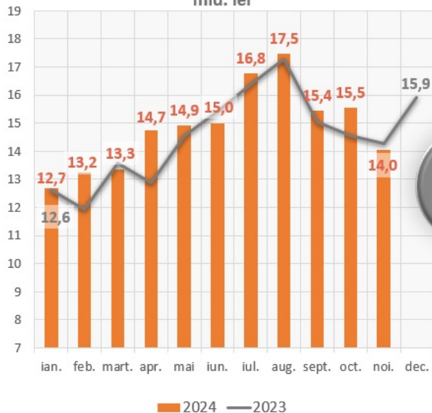
Dinamica lunară a eliberărilor banilor în numerar, mld. lei